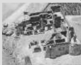
Kilwa Kisiwani - Tanzânia

A World Monuments Fund Portugal apresentou, no final de 2000, a candidatura da Sinagoga de Ponta Delgada ao Programa World Monuments Watch 2002. Este Programa lista, divulga e chama a atenção para os cem elementos da herança cultural universal que se encontram em pior situação no que se refere ao seu estado de conservação e que necessitam de uma intervenção urgente e qualificada. Procura ainda, agregando esforços de entidades públicas e privadas, recolher os meios necessários para levar a cabo os trabalhos necessários. Deste Programa fizeram parte, em 1996, a Fortaleza Portuguesa de Kilwa Kisiwani, na Tanzânia, actualmente a ser objecto de um projecto de consolidação e protecção, apoiado pela Fundação Calouste Gulbenkian, e a Ilha de Moçambique, onde cerca de 80% dos edifícios necessitam de intervenção urgente, num projecto liderado pela UNESCO.