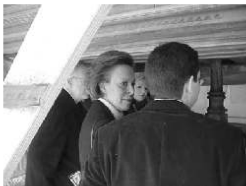
Pormenor da visita ao estaleiro