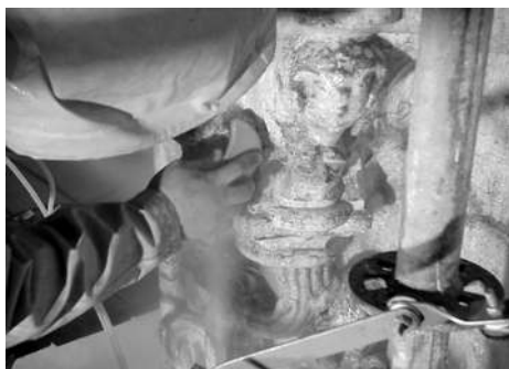
Limpeza por nebulização de água e Escovagem

Decorreu nos passados dias 15 e 16 de Janeiro de 2001 uma reunião da Equipa de Consultores Científicos deste Projecto que fez uma análise do decorrer dos trabalhos que, neste momento, se desenvolvem no alçado Este do Claustro e onde se prevê estarem terminados durante o próximo mês de Março. Em Setembro de 2000, tinha sido concluída a intervenção no alçado Norte, que compreendeu, como acções principais: