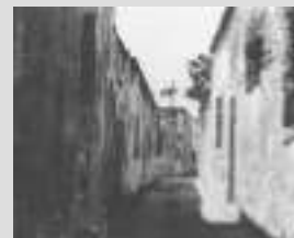
Ilha de Moçambique