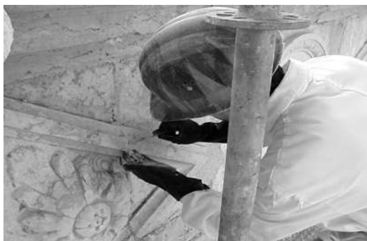
Refechamento de junta