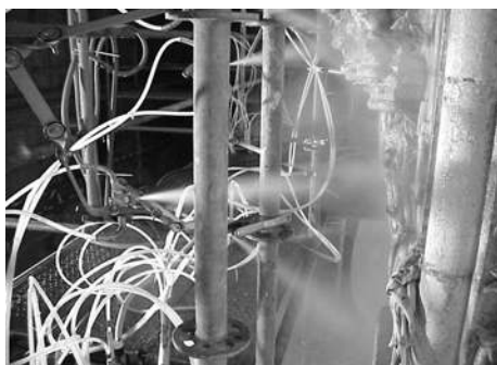
Limpeza por atomização de água