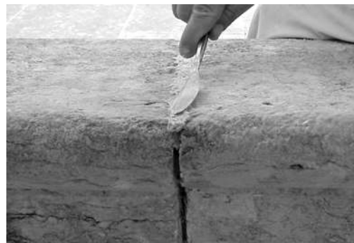
Pormenor de refechamento de junta