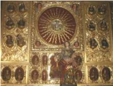
Retábulo/relicário em talha dourada da Sacristia

Dada a localização no centro da cidade de Lisboa, e a sumptuosidade que lhe foi conferida pela campanha de obras setecentista, a tradição denomina, a Igreja de S. Nicolau, como a Paróquia "do coração da cidade". Esta igreja tem já vindo a proceder a trabalhos de recuperação, tanto a nível do edifício como do espólio neste contido, que aliás é bastante rico, pois recebeu muitas e valiosas peças de igrejas e conventos extintos pela legislação liberal de 1834 e também pela República. A igreja tem duas áreas valiosas para trabalhos de conservação e restauro. Uma delas é o baptistério que tem um tecto do estuque coberto com as pinturas de têmpera neste local encontram também excelentes esculturas de madeira em talha dourada e uma pia baptismal original.