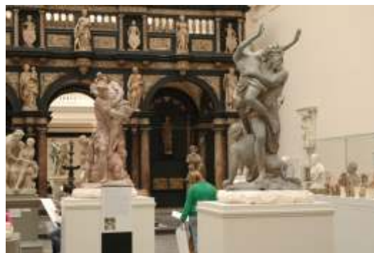
Estátuas no Victoria and Albert Museum

Está a ser planeado pela WMF um primeiro workshop de restauro de estatuária em chumbo em colaboração com o Instituto Português de Conservação e Restauro, cuja realização está prevista no decurso do próximo ano.