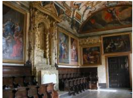
Coro Alto após restauro ©Junqueira 220