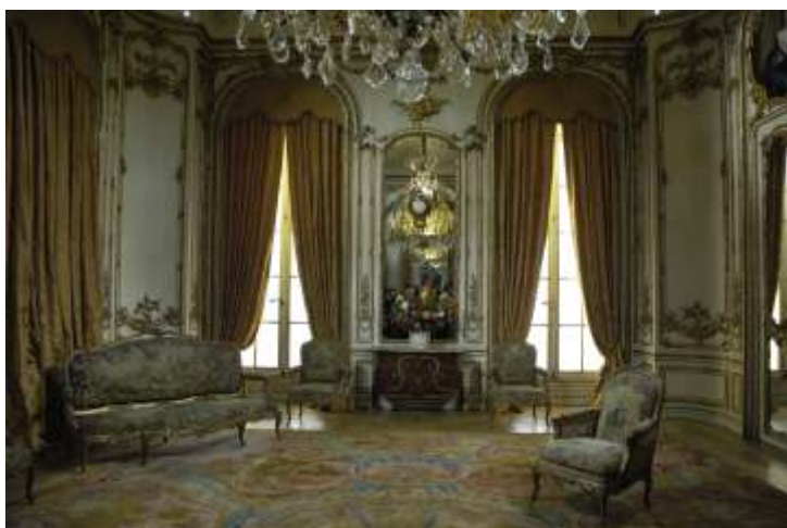
Sala Patiño após restauro