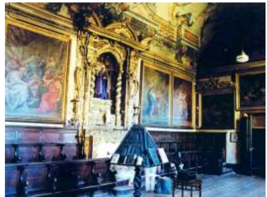
Coro Alto antes do restauro

Pretende-se ainda com este trabalho criar as condições de acesso e de visita pública à Igreja do Convento do Bom Sucesso, classificada como imóvel de interesse público pelo IPPAR, integrando-a, em breve, num circuito patrimonial da zona de Belém.