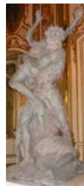
Estátuas no Palácio de Queluz