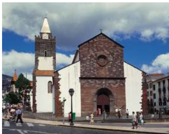
Fotografia da Sé do Funchal

O monumento, classificado desde 1910, teve ao longo dos anos intervenções, levadas a cabo por artistas excepcionais: mestres de pintura, de talha, douradores, prateiros, entalhadores, escultores e mestres de azulejaria. A partir de 1940, foram efectuadas pela DGEMN várias intervenções neste Monumento. O estado de conservação da Sé, melhorou consideravelmente após as recomendações da Comissão Científica da WMF-Portugal, que consistiam na instalação de um novo sistema de drenagem e calhas apropriadas nos terraços da Sé. De momento a WMF-Portugal está a elaborar um exame sobre a condição do exterior deste monumento o qual estará terminado no final deste ano.