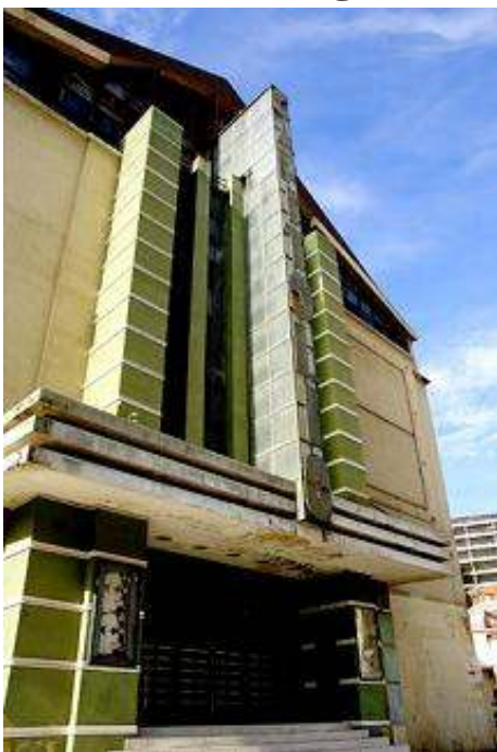
Fotografia actual do Teatro Capitólio

O Teatro Capitólio, no Parque Mayer, foi seleccionado para a lista World Monuments Watch - 100 Most Endangered Sites de 2006. A lista foi anunciada em Nova Iorque no dia 21 de Junho de 2005